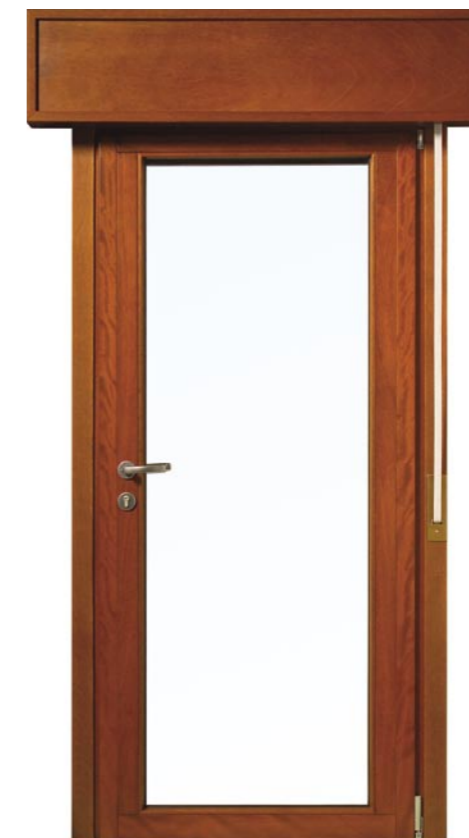
Porta Finestra Discovery

Sistema oscurante con controltaio in legno completo di accessori avvolgibile. Cassonetto all'italiana in multistrato sp 15mm a frontale liscio con guarnizione perimetrale. Telo avvolgibile in PVC con balza finale in alluminio da 5kg/mq.